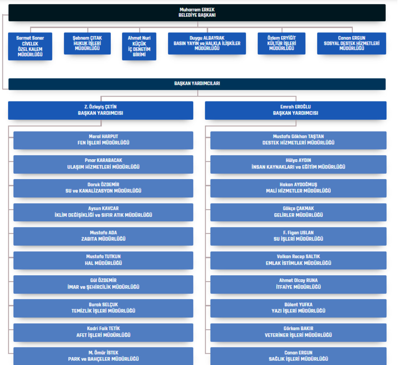
Şekil 1 – Örgüt Şeması (Güncel Tarihli)

Kamu kaynaklarının etkili ve verimli kullanılması, yerel hizmetlerin dengeli dağılımının temin edilmesi, belediyeler tarafından sunulan hizmetlerde kalitenin artırılması, ihtiyaç duyulan nitelik, unvan ve sayıda personel istihdamının sağlanması amacıyla yürürlüğe konulan Belediye ve Bağlı Kuruluşları ile Mahalli İdare Birlikleri Norm Kadro İlke ve Standartlarına İlişkin Yönetmelik doğrultusunda belediyemiz aşağıda yer alan şemadan da görüleceği üzere Ocak 2025 tarihi itibariyle 2 atanmış başkan yardımcısı ve 25 hizmet biriminden (müdürlük) oluşmaktadır.