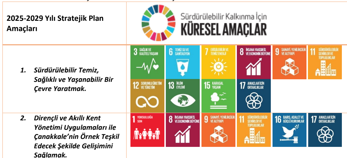
2025-2029 Stratejik Planımızın, Sürdürülebilir Kalkınma Amaçları ile ilişkisi; Tablo 14 -Stratejik Plan Kalkınma Planı İlişkisini Gösterir Tablo